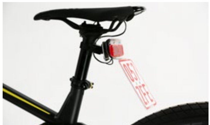
RECHTS Das Focus Thron hat einen unauffälligen Kennzeichenhalter, der zusammen mit dem Rücklicht am Sattelrohr angebracht ist. Für die, die damit ganz legal auf der Straße fahren wollen, ist das keine gute Lösung. Speziell bei kleineren Menschen kann das Kennzeichen schnell mit dem Hinterrad kollidieren. Auch beim Herausziehen der Sattelstütze droht Gefahr: Dabei kann das Stromkabel abgerissen werden, welches durch selbige geführt ist.