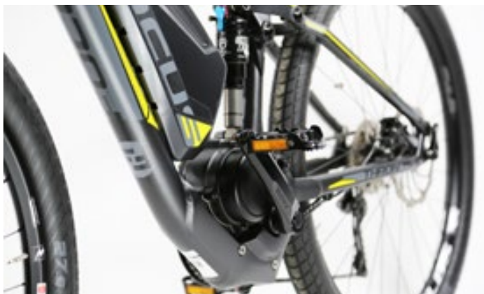
LEFT The drive system, made by daum electronic of Fürth, Germany, shows what it's capable of in the Thron . Being fitted above the downtube means that it's exceptionally well protected against grounding, for example when jumping over logs or boulders.